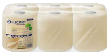
Colis de 6 RÉF.509101

BOBINE DEVIDAGE CENTRAL 450 F ECONATURAL