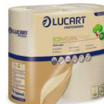
Colis de 12 RÉF.513901

ESSUIE-TOUT RL 150F- MAXI 1 = 3 - ECONATURAL