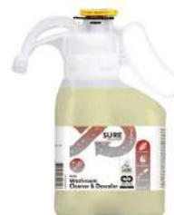
Bidon 1.4 L RÉF.520129

SURE Washroom Cleaner & Descaler Détergent détartrant sanitaires