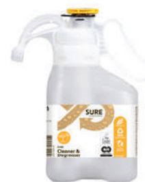
Bidon 1.4 L RÉF.519422

SURE Cleaner & Degreaser SD 1.4L - Dégraissant puissant