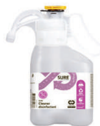
Bidon 1.4 L RÉF.519423

SURE Cleaner Désinfectant Nettoyant désinfectant concentré