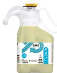
Bidon 1.4 L RÉF.519424

SURE Interior & Surface Cleaner Nettoyant multi-usages